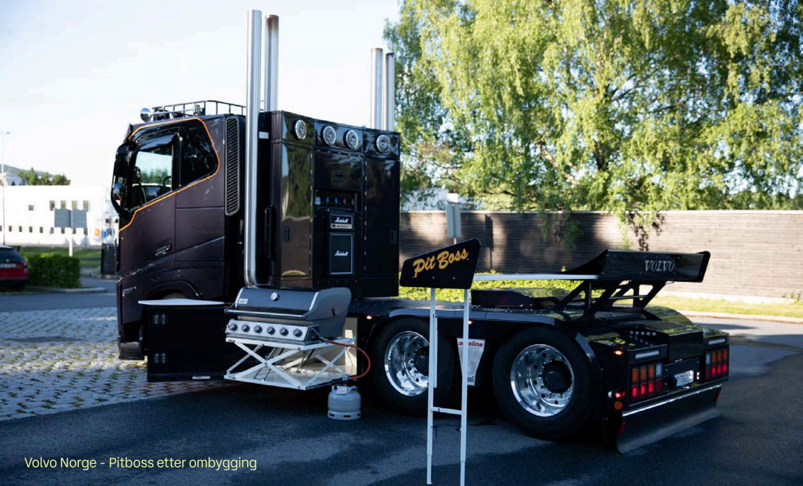
Volvo Norge - Pitboss etter ombygging