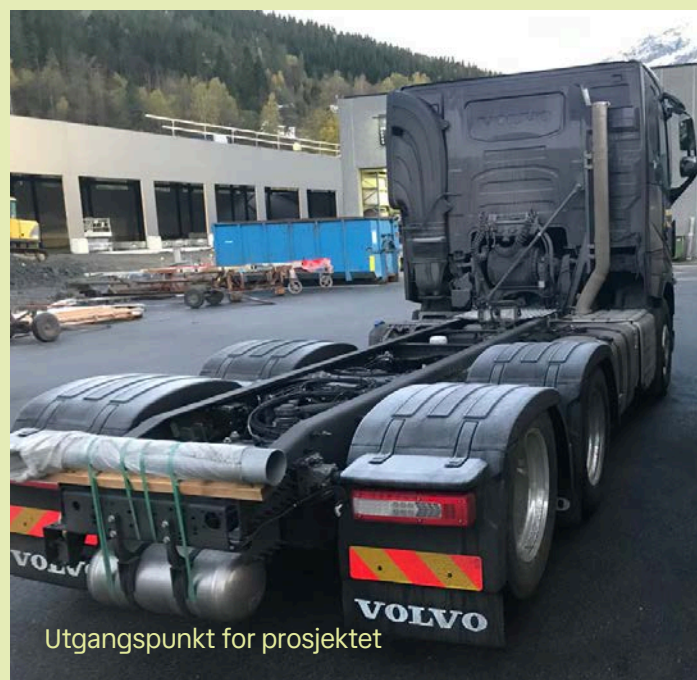
Utgangspunkt for prosjektet

Nomek bygger lastebilpåbygg som varer – og som gjør en forskjell i arbeidshverdagen.